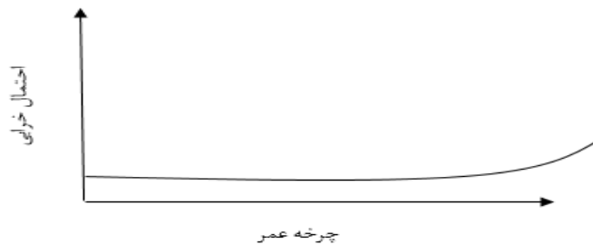
شکل ۱. سن و ارتباط آن با خرابی (ملکور و همکاران ۲۰۱۵)

های ساده نگهداری و تعمیر روزمره مانند تمیز کردن، تعمیر و نگهداری، و روانکاری بکار برده شده است (ملکور ۱ و همکاران، ۲۰۱۵).